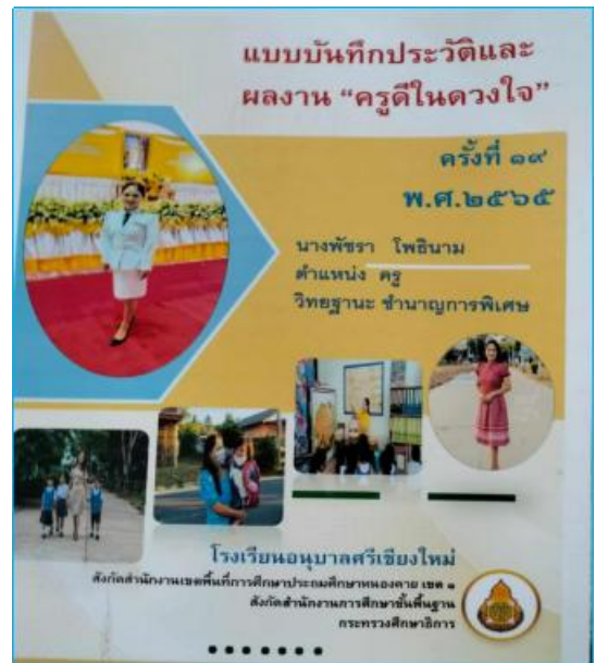
รางวัลรองชนะเลิศอันดับ ๑ ครูดีในดวงใจ ครั้งที่ ๑๙ ปี ๒๕๖๕