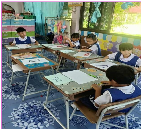
๖) เด็กๆเขียนตัวพญานาคลงในใบกิจกรรม