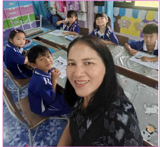
๓) ครูอธิบายขั้นตอนวิธีการปั้นพยานะไทยบนแผ่นกระดาษที่ถูกตัด