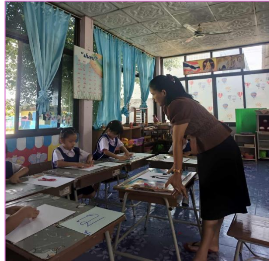
๔) ครูสาธิตการทำการปั้นพยานะให้เด็กๆดูเป็นตัวอย่าง