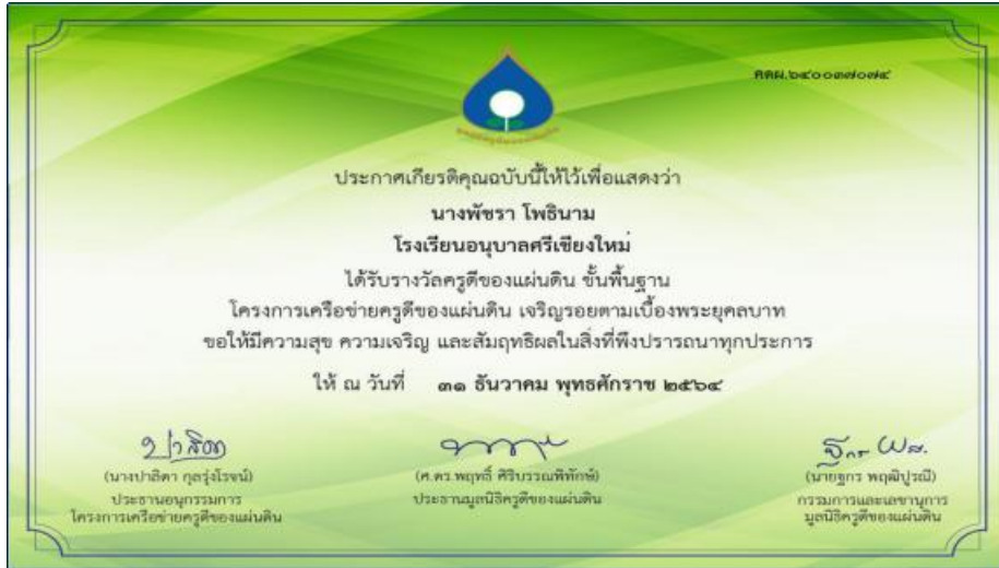
รางวัลครูดีของแผ่นดิน