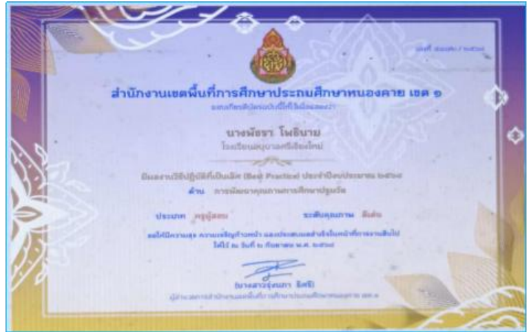
รางวัลรองชนะเลิศระดับดีเด่น การคัดเลือกBest Practice ประเภทครูผู้สอน ปีงบประมาณ ๒๕๖๘