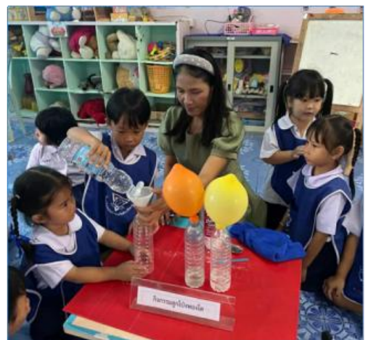
รางวัลการประกวดนวัตกรรมและวิธีปฏิบัติที่เป็นเลิศด้านการจัดประสบการณ์การเรียนรู้ระดับปฐมวัยระดับดีมาก ขอรับรองว่าภาพถ่ายและเกียรติบัตรเป็นจริงทุกประการ