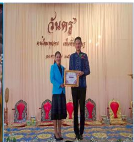
รับรางวัลครูผู้มีความดีเด่น สมควรได้รับการยกย่องเชิดชูเกียรติ เนื่องในวันเกียรติยศ”ครูดี ศรีเชียงใหม่” เนื่องในโอกาสวันครู ครั้งที่ ๗๐ (๑๖ มกราคม ๒๕๖๙) จากนายอำเภอศรีเชียงใหม่

ขอรับรองว่าภาพถ่ายและเกียรติบัตรเป็นจริงทุกประการ