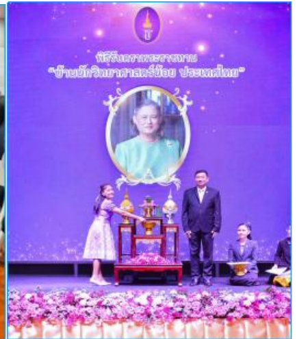
ผู้รับผิดชอบงานบ้านนักวิทยาศาสตร์น้อยประเทศไทย ระดับปฐมวัย และเป็นตัวแทนขึ้นรับตราพระราชทานบ้านนักวิทยาศาสตร์น้อย ประเทศไทย ณ อาคารพิพิธภัณฑ์วิทยาศาสตร์แห่งชาติ ประจำปี ๒ จ.ปทุมธานี เมื่อวันที่ ๒๐ ส.ค ๖๘