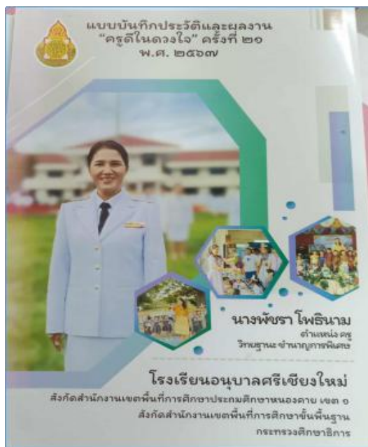
รางวัลรองชนะเลิศ ครุฑใจใส ครั้งที่ ๒๑ ปี ๒๕๖๗ ระดับสพ.หนองคายเขต ๑